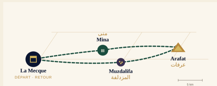
Le parcours sacré · La Mecque → Mina → Arafat → Muzdalifa → Mina → La Mecque